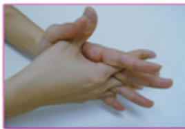
⑤指の間を洗いましょう