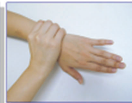
⑦手首にすりこみましょう