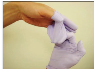
②手袋の外側が内側になるように外す。