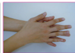
②石けんをよく泡立てながら、手のひらを洗いましょう