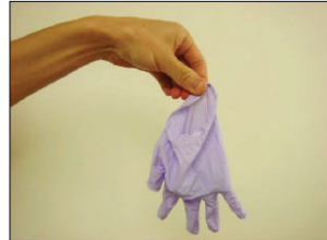
⑤手袋外側が内側になるように外す。オレンジハザードへ廃棄する※)