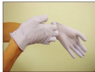
⑤手首までしっかり伸ばして装着する。