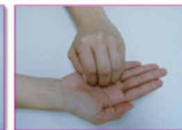
③指先・爪の間を念入りに洗いましょう