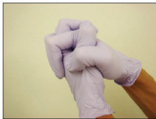
⑥手袋の中の空気を抜く。