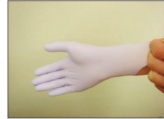
③利き手に装着する。