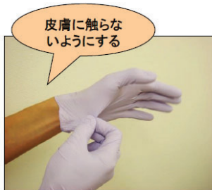
①利き手で反対側の手袋の手首部分をつまむ。