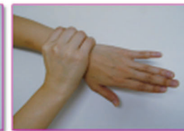
⑦手首を洗いましょう