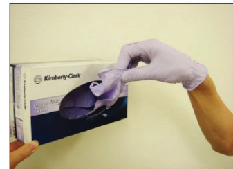
④手袋を装着した手でもう片方の手袋を取り出す。飛び出た手袋は箱の中に押し戻す。