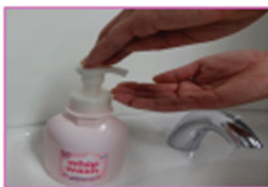
①はじめに、水で手をぬらし、石けんを手にとりましょう