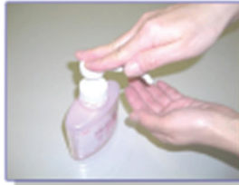
①適量(1プッシュ)を手にとりましょう