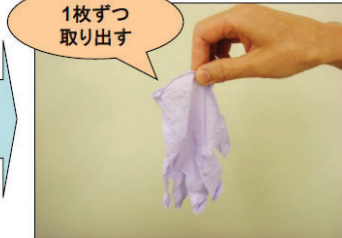
②利き手で手袋を取り出し、できるだけ表面に触れないように持つ。