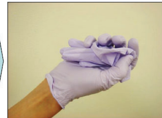
③外した手袋を利き手の手に丸めて握る。