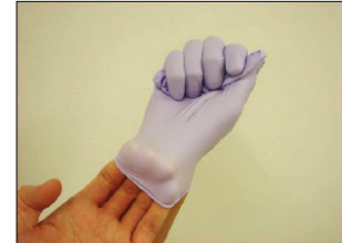
④手袋を外した手を利き手の手袋の手首内側に差し込む。